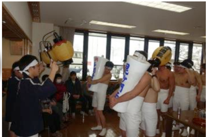
3日裸押し合い祭り当日、堂内での押し合いの様子