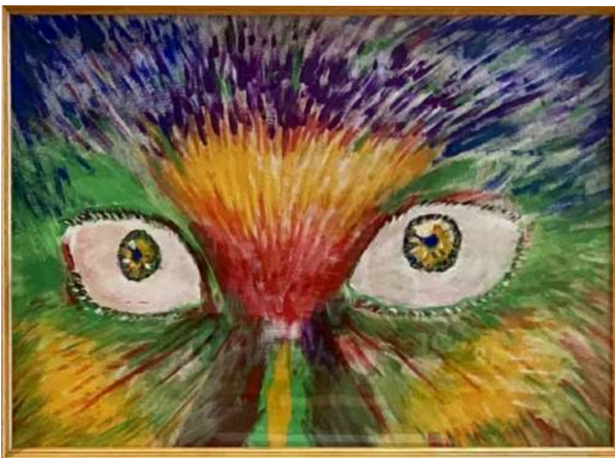
作 小林あゆみ 題 スピリット

となると、悩みを言語化し慣れないのは『我慢』してきた過去や、我慢が美德という風潮も原因のひとつなんじゃねーの?!という事で悩み解決の第一歩は相手に伝える言い方を知ること、あんまり我慢しないこと。言うは易し!